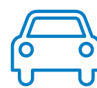
INTÉRIEUR DE VÉHICULES