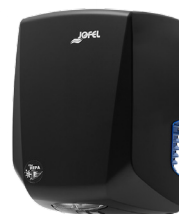
AA56600-MT 8427950367427 Finition noire mate