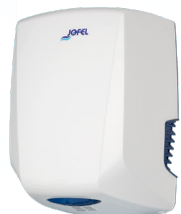
AA56000 8427950367342 Finition blanche