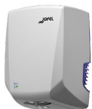
AA56300 8427950367380 Finition argent