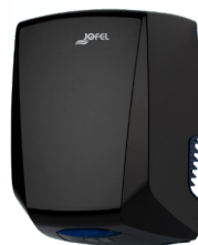
AA56600 8427950367427 Finition noire